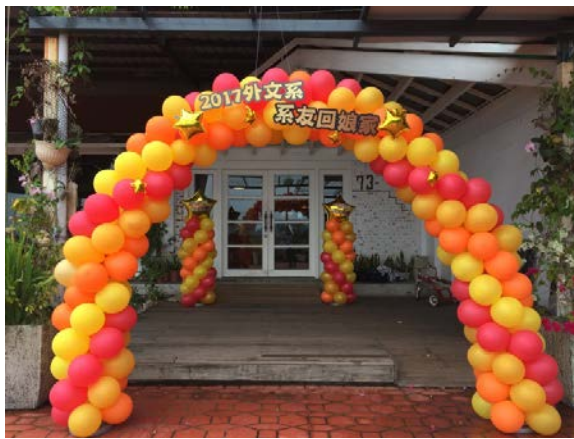
系友回娘家於 73 階咖啡舉行

因為一場連夜豪雨使逸仙館漏水，今年度的大英劇在開演前一個月臨時更換演出地點至演藝廳，系友回娘家活動也一同移師到學生活動中心三樓的〈73 階咖啡〉舉辦。系友回娘家活動當天除了有 30 位系友返校參加，已經轉任高雄醫學大學的王儀君老師及蘇其康老師也抽空回來看看大家，張錦忠主任歡迎系友們常常都可以回娘家走走，看看老師們，看看系上。許多系友表示畢業後是第一次參加回娘家活動，覺得這樣的聚會很溫馨也很開心。98 級的系友參與的最踴躍，有 8 名系友相約一同返校，他們回憶起當年參與大英劇演出的戲碼正是《我愛紅娘 Hello, Dolly!》，事隔 10 年再次欣賞這齣戲劇感覺格外的有意思。系友回娘家活動約於 6 點半結束，在西子灣迷人的夕陽下，系友們渡過一個溫馨愉快的敘舊時光，也為回娘家活動畫上完美的句點。